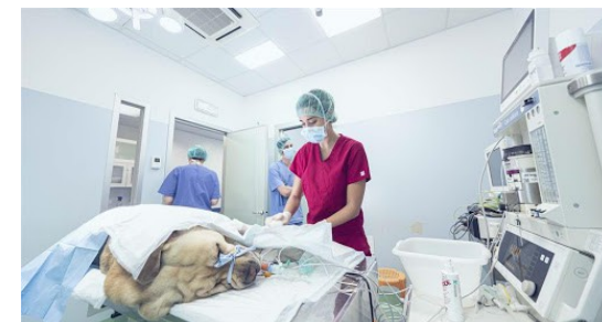
Set Chirurgia Laparoscopica