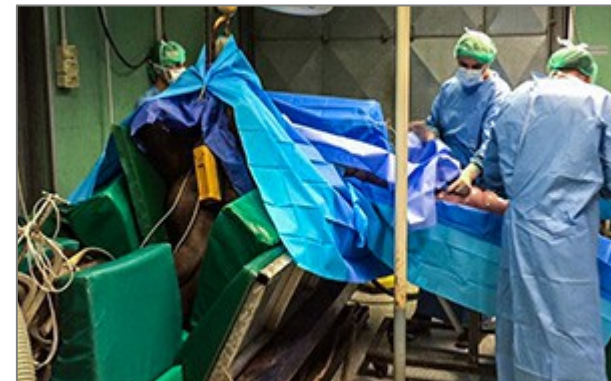
Set Chirurgia generale grandi animali