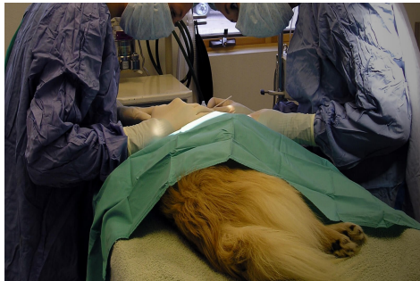
Set Chirurgia generale piccoli animali