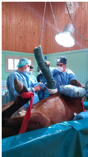
Set Chirurgia Ortopedica