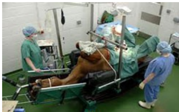
Set Colica Equina